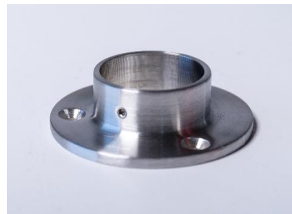
BASE PARA TUBO Ø 42,4X2 INOX 304 BASE PARA TUBO Ø 48,3X2 INOX 304