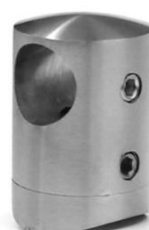
PASSADOR PARA VARÃO Ø 12 INOX 304