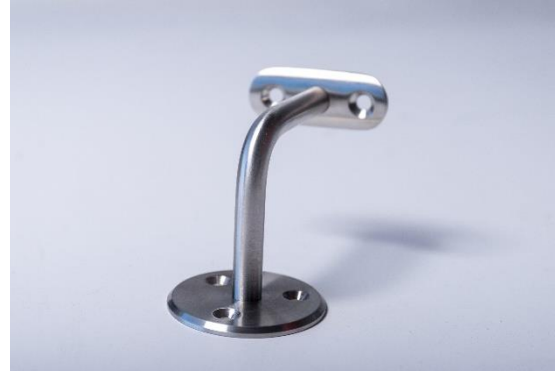
SUPORE PAREDE TUBO Ø 42 - 48 INOX 304