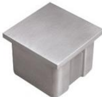
TOPO PARA TUBO QUAD. 40 INOX