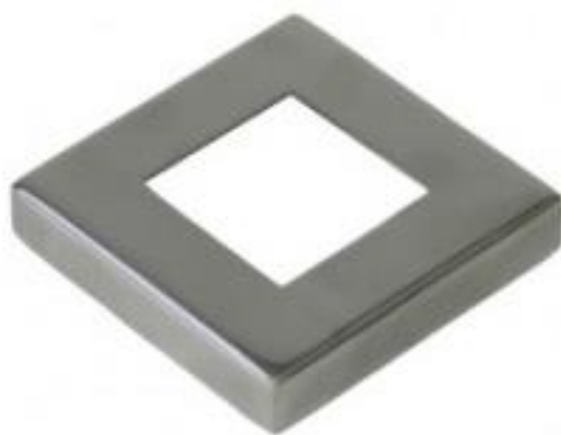
ESPELHO PARA TUBO QUAD. 40 INOX