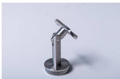
FIXADOR ARTICULADO TUBO Ø 42 - 48 INOX 304