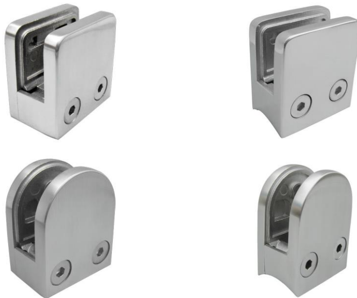
SUPORE PARA VIDRO 8MM – 10MM (BASE REDONDA OU QUADRADA)