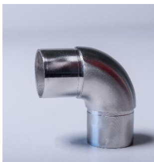
CURVA ARTICULADA TUBO Ø 48,3X2,0 INOX 304