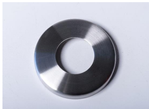
ESPELHO TUBO Ø 42,4X85 INOX 304 ESPELHO TUBO Ø 48,3X105 INOX 304