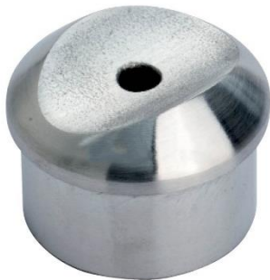
BOCA-LOBO TUBO Ø 42,4X2,0 INOX 304