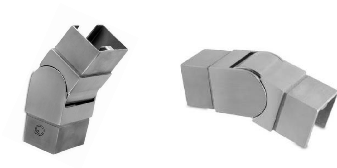
CANTO ARTICULADO PARA TUBO QUAD. 40 INOX