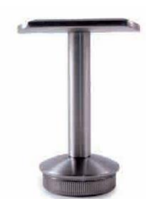
FIXADOR FIXO TUBO Ø 42 - 48 INOX 304