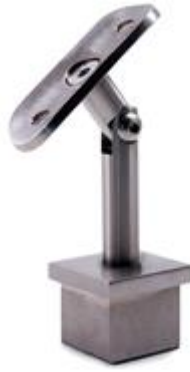
FIXADOR ARTICULADO PARA TUBO QUAD. 40 INOX