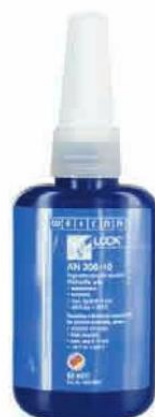
COLA PARA INOX - 50 ML.