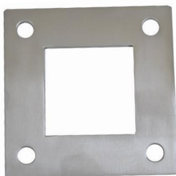
BASE PARA TUBO QUAD. 40 INOX