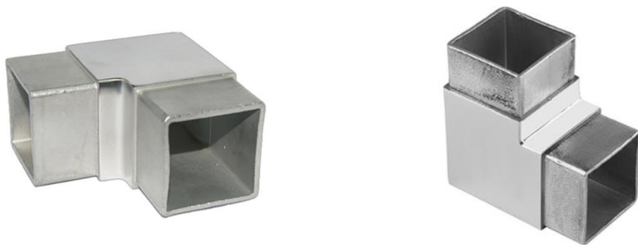
CANTO PARA TUBO QUAD. 40 INOX