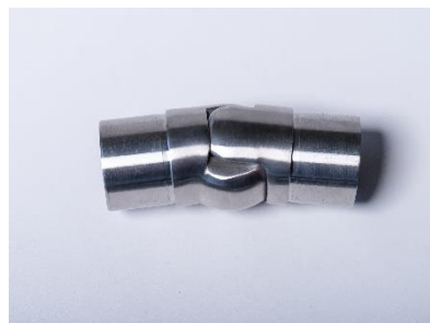
CURVA ARTICULADA TUBO Ø 42,4X1,5 INOX 304