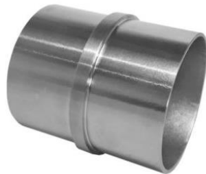
UNIÃO TUBO Ø 42,4X2 INOX 304 UNIÃO TUBO Ø 48,3X2 INOX 304