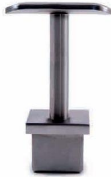
FIXADOR FIXO PARA TUBO QUAD. 40 INOX