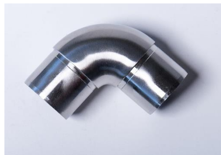
CURVA DE COLAR TUBO Ø 42,4X2,0 INOX 304